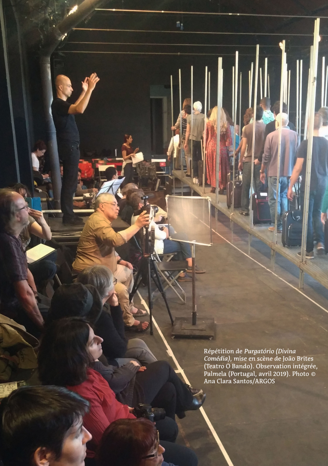
Répétition de Purgatório (Divina Comédia) , mise en scène de João Brites (Teatro O Bando). Observation intégrée, Palmela (Portugal, avril 2019).