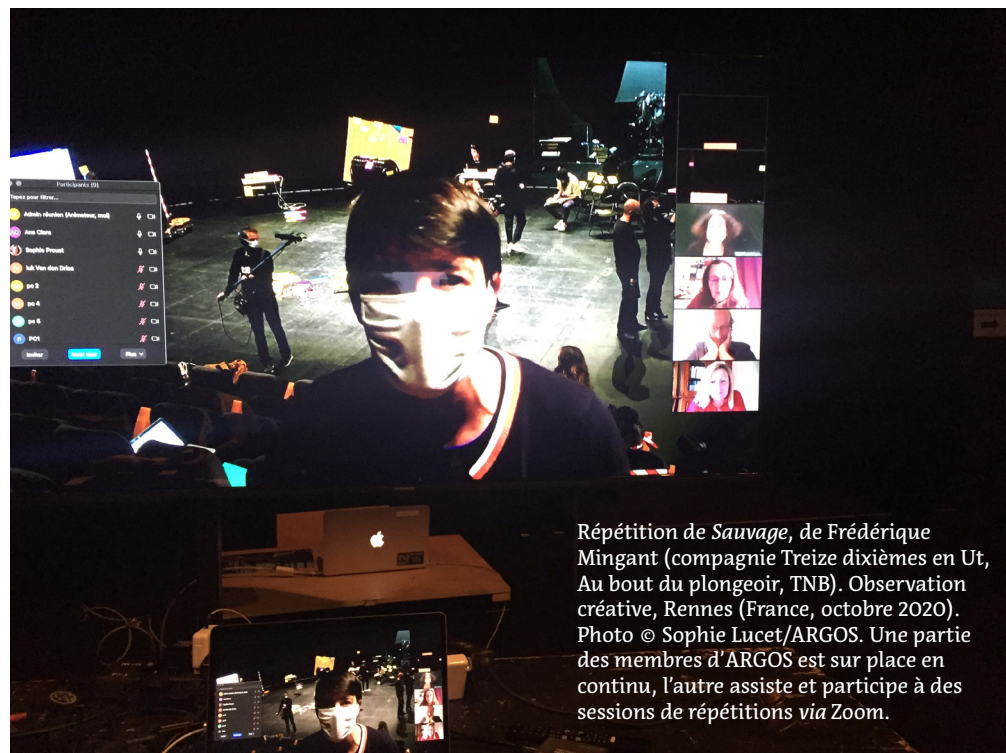
Répétition de Sauvage , de Frédérique Mingant (compagnie Treize dixièmes en Ut, Au bout du plongeur, TNB). Observation créative, Rennes (France, octobre 2020). Une partie des membres d'ARGOS est sur place en continu, l'autre assiste et participe à des sessions de répétitions via Zoom.

Une partie des membres d'ARGOS dans la salle immersive tandis que les autres assistent à la répétition dans la salle Serreau.