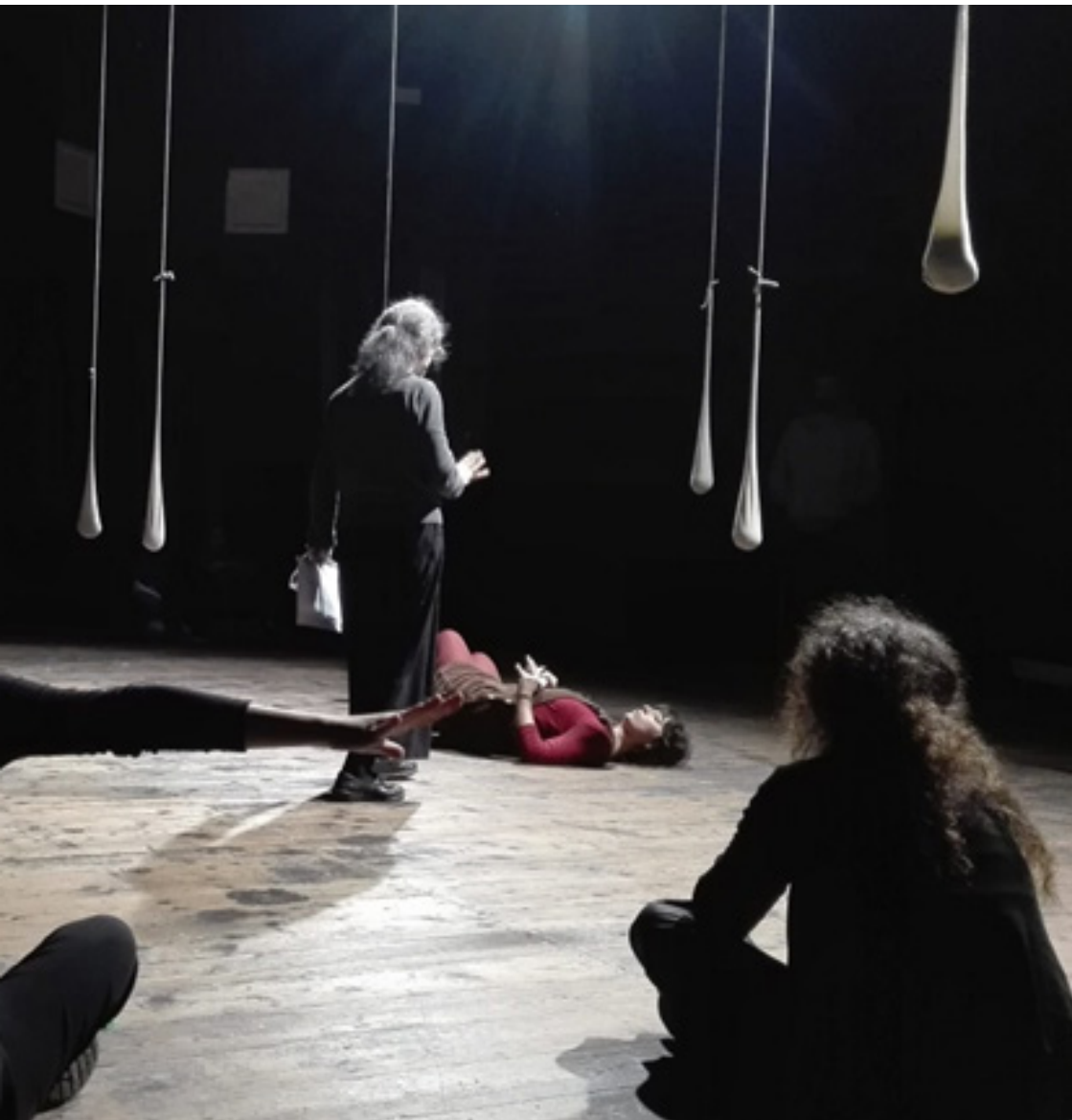
Répétition de La terra dei Lombrichi , mise en scène de Chiara Guidi (Societas). Cesena (Italie, décembre 2019).